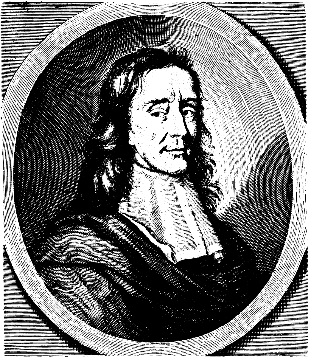
ULRICUS HUBER FRISIUS J.C.

Primum Leg. et Aist. in Acad. Franco. mox ibid. Juris priv. & publ. Professor. Dein Senator in Supr. Fris. Curia Exinde in. Academiâ Loveniâ causa notioris. Aet. L VII. MDC XCII.